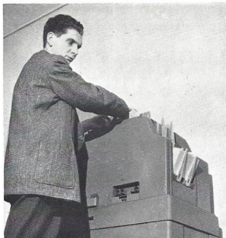
Collatoren sættes i sving.

Til denne maskine kan kobles en hullemaskine (sumpunch), således at hver gang ma-