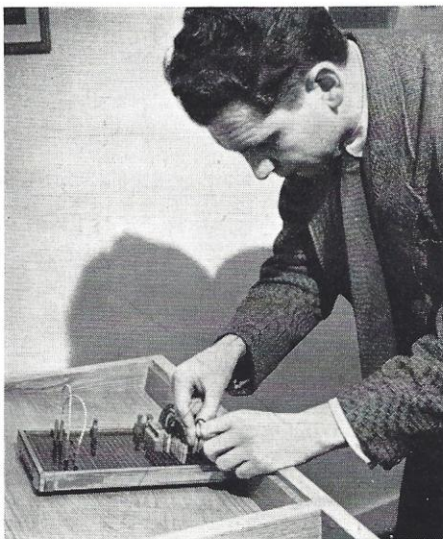
Maskinens funktionstavle kobles.

Vi har kaldt kortet grundpillen i systemet, det er det også. Det kan anvendes til utallige formål, når det først er hullet, men, for der er et men, endda et stort, kortet skal være hullet korrekt. Derfor er det af stor betydning, at bilagene er udfærdiget rigtigt og tydeligt. Damerne, der betjener