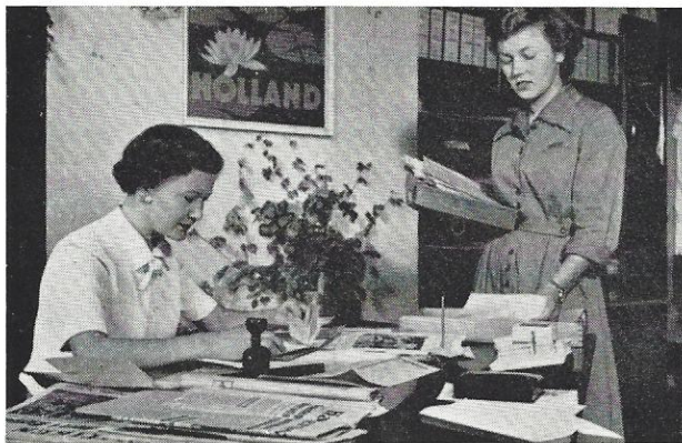
Der „tømmes“ i PHILIPS reklameafdeling.