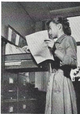
Gårdagens udcirkulerede post arkiveres.