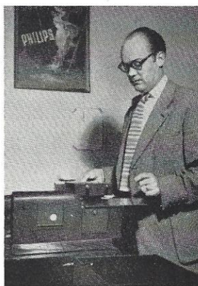
Overgaard frankerer dagens post.