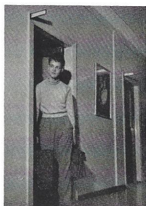
På vej til posthuset.