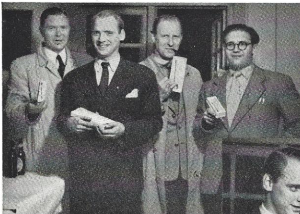
De lykkelige vindere af handicapskydningen.