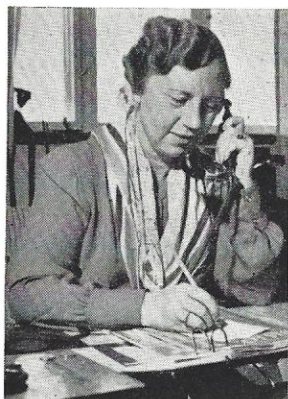
Fru Trolle besvarer alle forespørgsler.