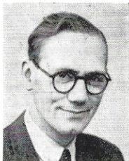
Født 1. 5. 1911