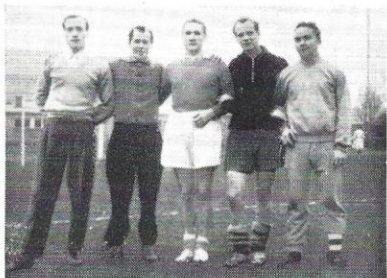
Snapshot fra five-a-side turneringen Øverst ses de 2 vindende hold, nederst 2 situationer fra de spændende kampe.