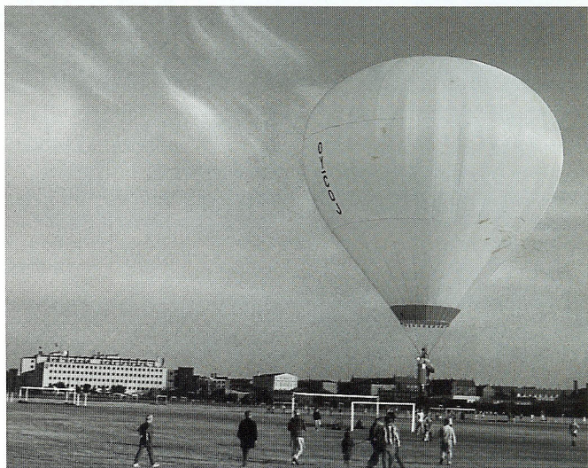
Opstigning over Kløvermarken – Industrigården skimtes i baggrunden.