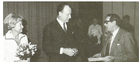
Sv. Loft siger tillykke fra Fællesklubben med bøger om Danmark og om fagbevægelsen.