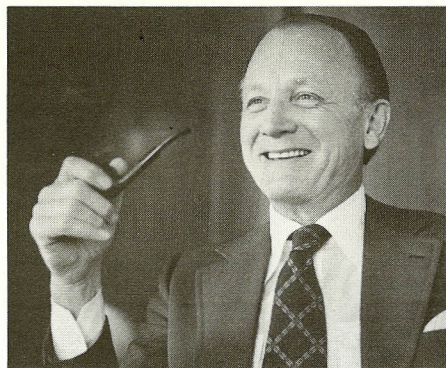
– Jeg tror ikke, jeg ville egne mig til at være patriark ...