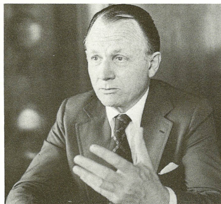
– I dag og i den nærmeste fremtid er det industrielle problem det, vi må give højeste prioritet.