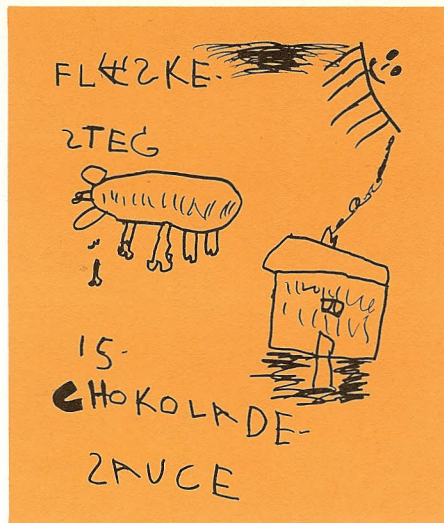
Forud for „børnemiddagen“ vil kantinerne være forsynet med menukort, udført af børnehavenene. Her ses 6-årige Pia Dalgårds forslag.