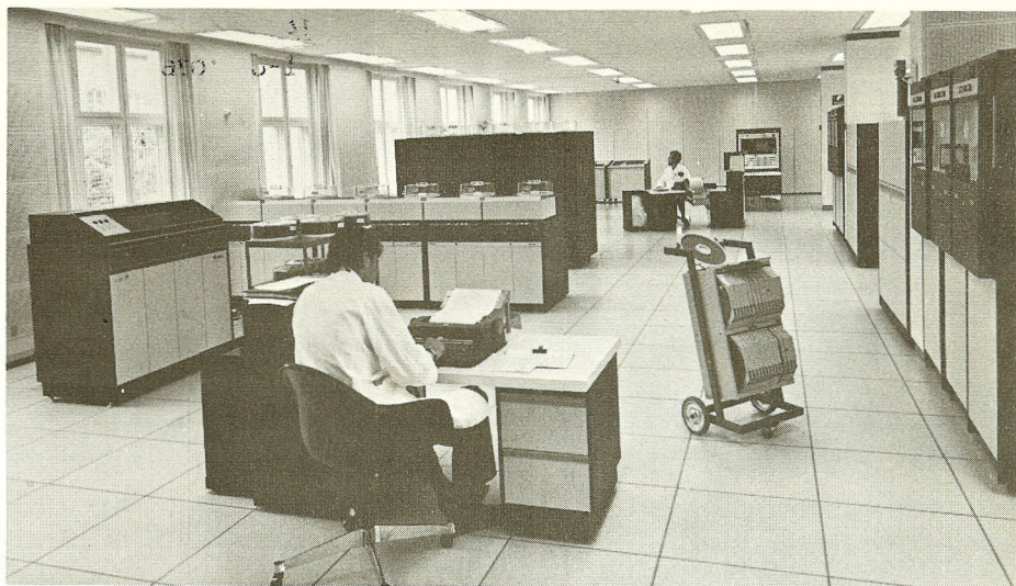
Datacentret på Industrigården med de to store Philips datamaskiner P 1200.