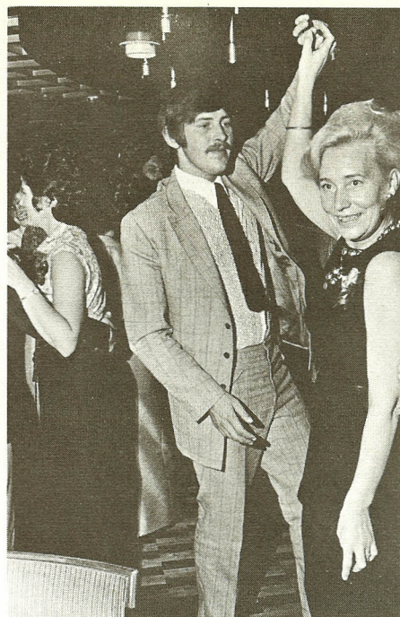
Der var liv på dansegulvet under jubilæumsfesten på „Kystens Perle“.