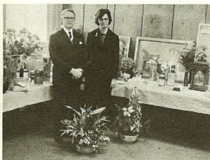
Det bugnende gavebord var et festligt vidnesbyrd om jubilarens popularitet.