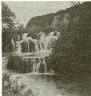
I alt findes der 16 Plitvice-søer, der indbyrdes er forbundne af små vandfald.

Skibets restaurant er for det meste optaget af sovende passagerer, men det gør ikke spor, da de fleste passagerer medbringer masser af proviant og gavmildt deler med den mærkelige udlænding, der er med skibet. Man bliver budt på hønsefars, hele paprikafrugter, fårepølse med hvidløg, saftige stykker vandmelon samt brød og en omvandrede flaske vin. Er man lidt sart, er det nok klogest at have et krus ved hånden.