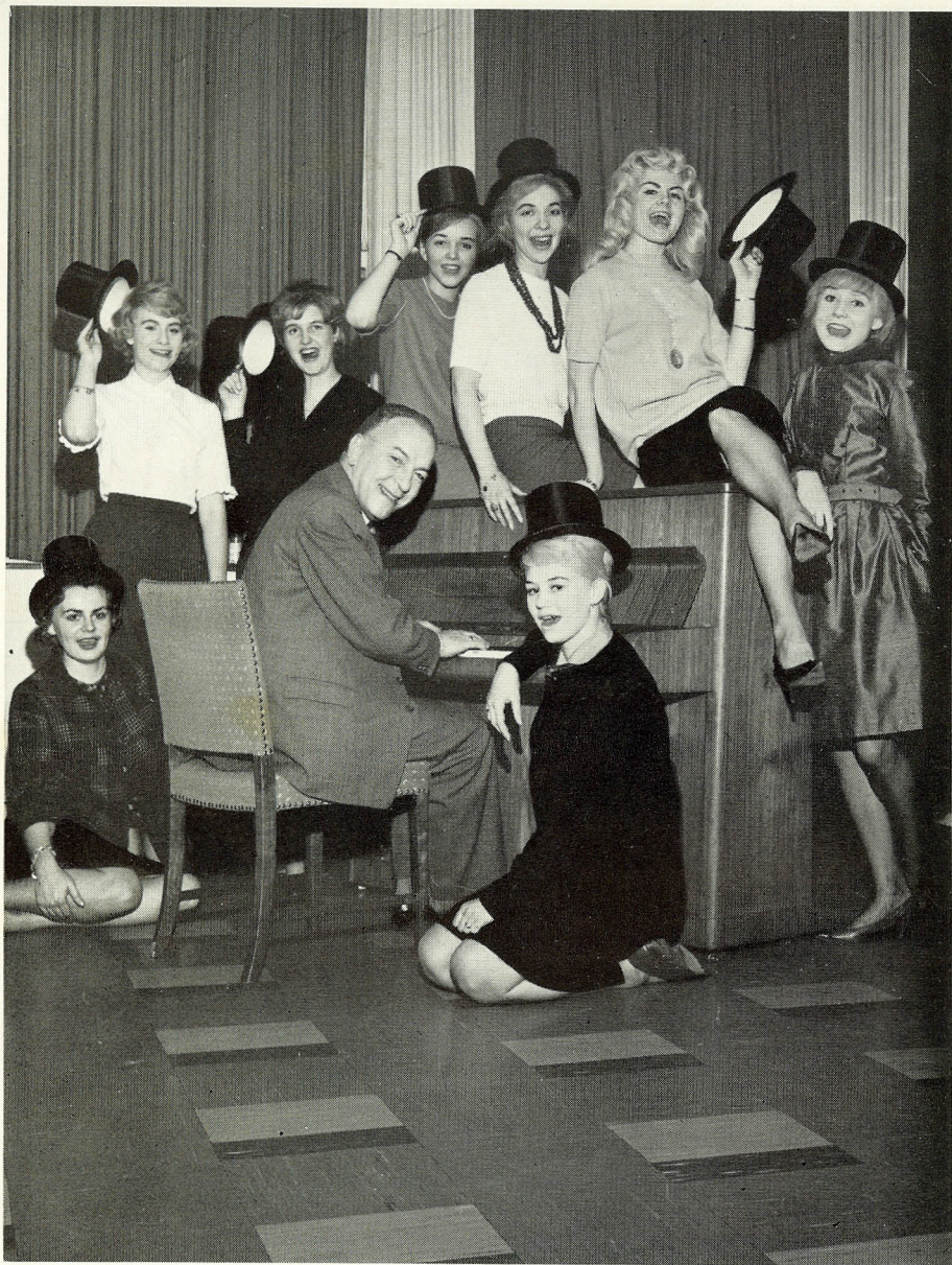
Vi er med på noderne – hele koret