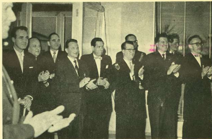
De klappede for os alle, da relief'et blev afsløret