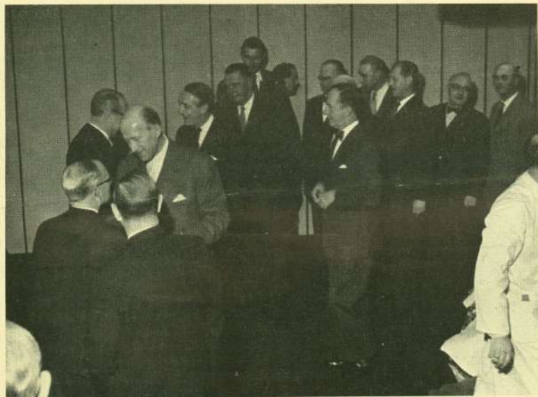
Gratulanterne stod i kø - som her - for at lykønske