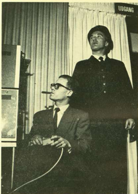
Fjernsynsteknikeren, der »styrede« den interne Philips-udsendelse – og brandmanden, der passede på, at der ikke gik ild i nogen