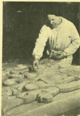
En optagelse fra Den kongelige Porcelainsfabrik, hvor man er i færd med at sammenholde farveprøver med relief'et, efter at det er blevet brændt første gang.