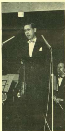
Sv. Loft på tribunen