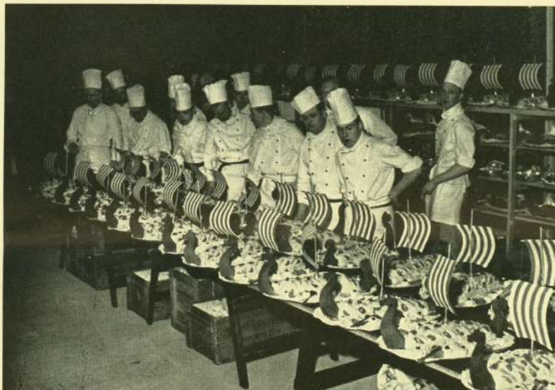
Nogle af de 20 kokke ved resultatet af deres forenede anstrengelser