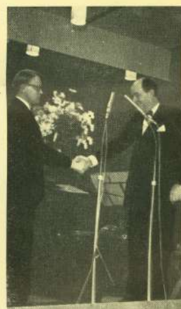
De to »dagens mænd« udveksler komplimenter