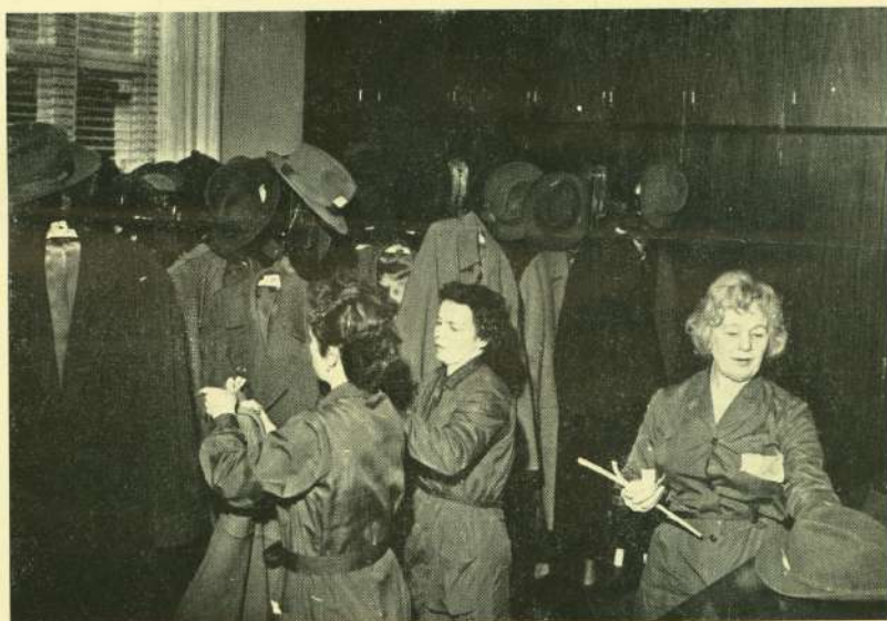
En helt ny måde at anvende personalekontoret på