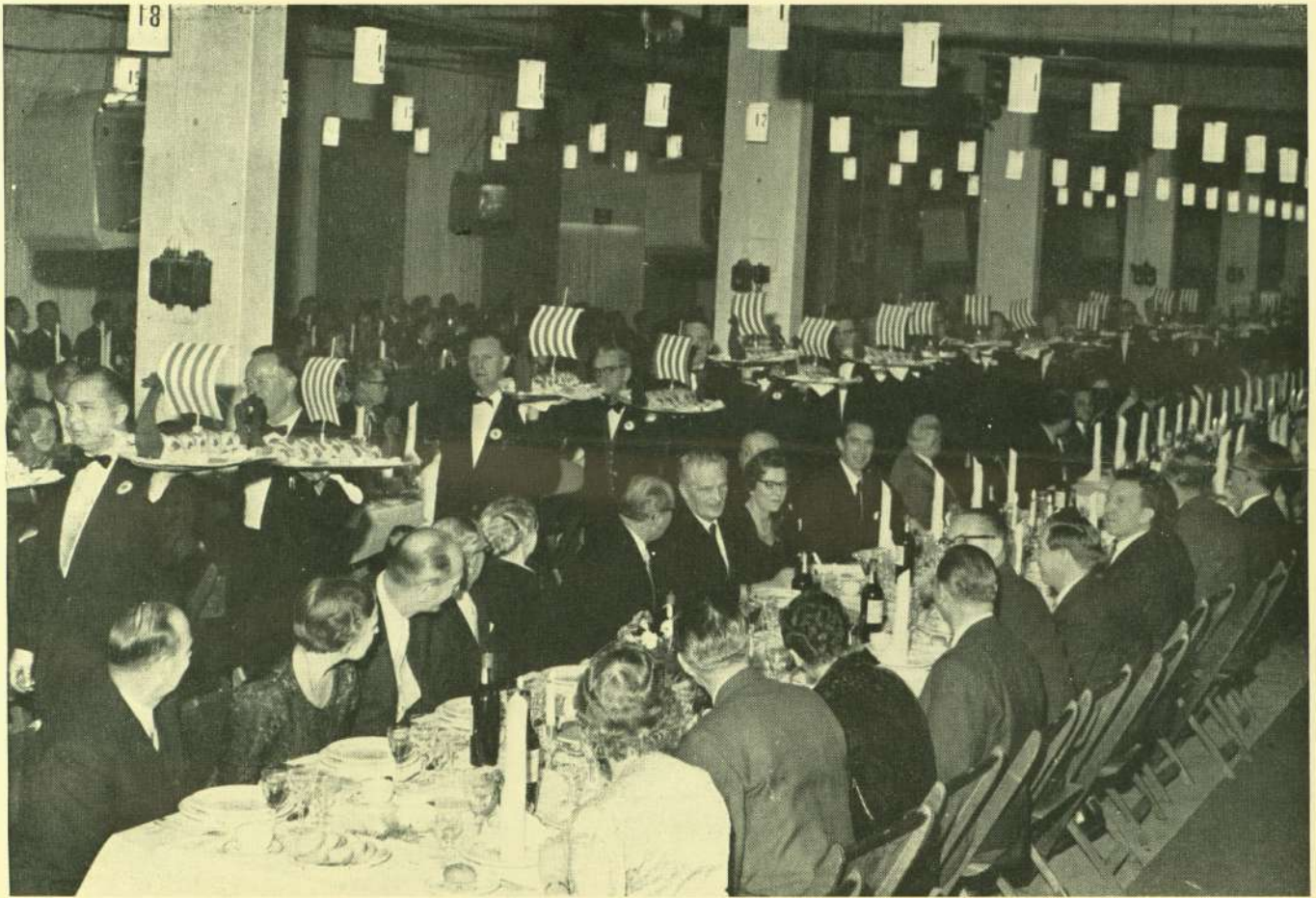
Her er 16 vikingskibe i den procession, hvormed de 135 tjenerer indledte frokosten