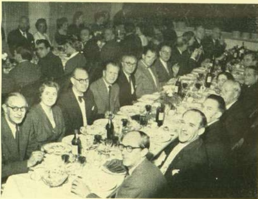
Jubilæar-bordet - 959 år