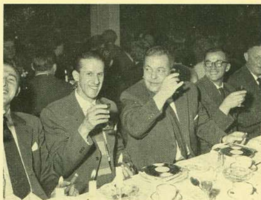
Vægtene holdt fri