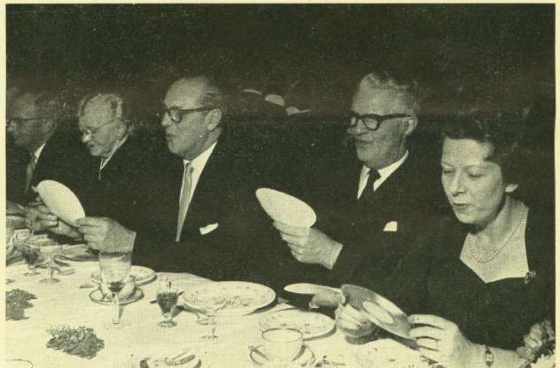
Fællessang ved direktions-bordet