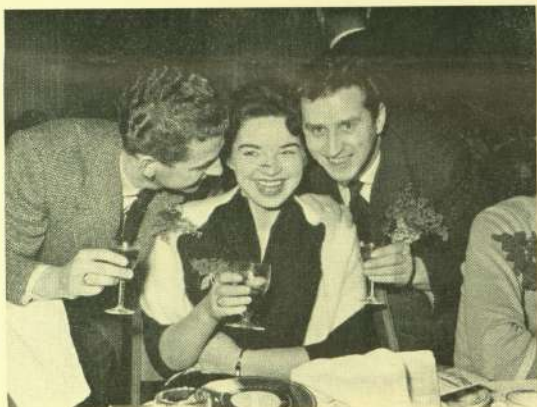
Jovist var der stemning