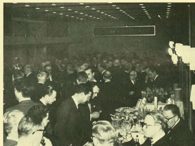
Et udsnit af den tæt pakkede receptionssal