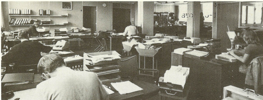
De 12 medarbejdere på ordrekontoret i Philips Elektronik-Systemer A/S sidder i et dejligt kontorlandskab.