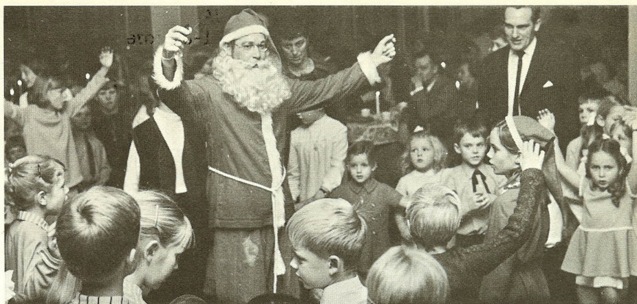
Julemanden Hornsleth lader ved PPR's julefest lørdag den 5. december tjørnehækken vokse op i „Tørnehøje var et vakkert barn“.

Stof må være redaktionen i hænde senest den 19. januar.