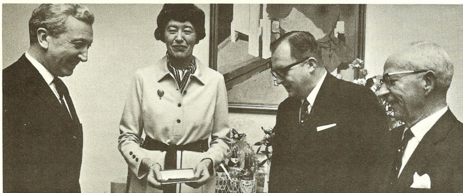
– Ej så nydeligt, sagde de, og det var det.

Regler for deltagelse kan rekvireres i Philips Skole Service på Industrigården, lokal 369.