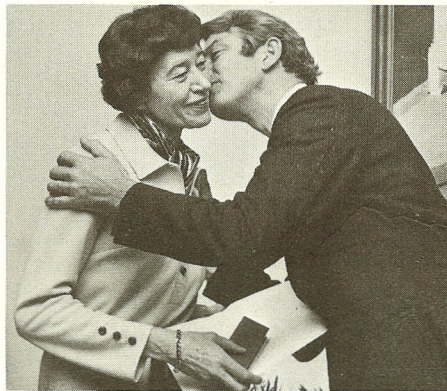
Ja sandt for dyden, er det en smuk tradition ...