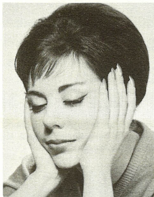
Det er fristende, men farligt at stramme sig op med piller, når man er træt.

Dette i forbindelse med, at lægen ikke i så høj grad personlig er bundet til sit undersøgelsesstativ, og sidst, men ikke mindst, at strålingsrisikoen er betydeligt nedsat for patient og læge selv med bibeholdelse af et lysstærkt billede, har medført, at røntgenfjernsynet nu vinder