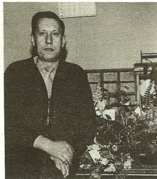
15. januar havde Sv. Loft været fællestillidsmand i 10 år. Den usædvanlige mærkedag indbragte ham naturligvis mange gratulationer fra såvel ledelse som kolleger. Nogle sagde det med blomster.